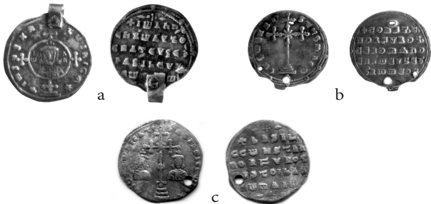
2. att. a – Konstantīna VII un viņa dēla Romāna II (945–959) miliarsisjs, sv. 2,27 g, d. 23 mm, CVVM 229729; b – Jaņa I Cimīscēs (969–976) miliarsisjs, sv. 2,8 g, d. 21 mm, CVVM 197308: 2; c – Basīlija II un viņa brāļa Konstantīna VIII (976–1025) miliarsisjs, sv. 1,96 g, d. 22 mm, CVVM 227011: 1

Austrumeiropā un Skandināvijā Bizantijas monētas nav atrastas tik lielā daudzumā kā arābu kalifātā kaltie kufiskie dirhēmi, jo atšķirībā no dirhēmiem tās galvenokārt bija kaltas Bizantijas iekšējam tirgum. Latvijā zināmi primitīvie atdarinājumi pēc dirhēmiem un Rietumeiropas denāriem, kamēr miliarsiju atdarinājumu nav. 8 Toties mūsu kaimiņu zemēs, piemēram, Zviedrijā, Somijā, Igaunijā, miliarsiju atdarinājumi bija izplatīti. 9 10. gs. beigās – 11. gs. sākumā pēc Bizantijas miliarsiju parauga bija kaltas pirmās Senās Krievzemes monētas – zlatņiki un serebrjaņiki. Latvijā lielākā daļa miliarsiju bija lietota kā monētpiekariņi, jo to forma, izmēri, kalšanas tehnikas mākslinieciskā meistarība un svēto vai valdnieku attēli uz tiem veicināja monētu kā rotaslietu izmantošanu. Naudas apgrozībā Latvijā 11. gadsimtā Bizantijas monētu loma bija nenozīmīga.