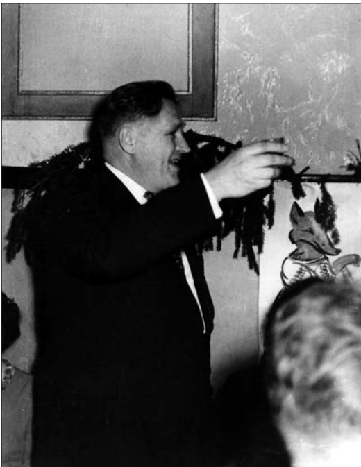
Laimīgu Jauno gadu! (60. gadi)