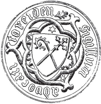
1. att. 15.–16. gadsimta Turaidas fogta zīmoga nospiedums

Kokneses fogti apliecināja dokumentus ar amata zīmogiem 1417. gadā, 64 Kokneses fogts – 1428., 1509., 1541. gadā u.c. 65 Diemžēl fiziski dokumenti nav saglabājušies, lai arī 19. gadsimtā tika fiksēts dokuments ar Turaidas fogta zīmoga nospiedumu 66 (1. att.). Ir zināms 15. gadsimta Kokneses fogta zīmoga 67 un 15.–16. gadsimta Turaidas fogta bronzas zīmoga spiedņa apraksts. 68 Uz zīmogiem bijuši uzraksti latīņu valodā – “Turaidas fogta zīmogs” ( sigillum – advocati – toreiden ) un “Kokneses fogta zīmogs” ( sigillum