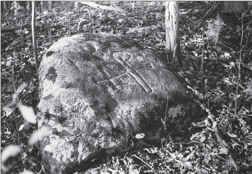
2. att. Meiru robežakmens ar Rīgas arhibīskapa heraldisko simbolu – sakrustotu bīskapa zizli un krustu – apmēram 1,5 km attālumā no Turaidas pils. 1976. gada foto no Turaidas muzejrezervāta krājuma

Kokneses fogti apliecināja dokumentus ar amata zīmogiem 1417. gadā, 64 Kokneses fogts – 1428., 1509., 1541. gadā u.c. 65 Diemžēl fiziski dokumenti nav saglabājušies, lai arī 19. gadsimtā tika fiksēts dokuments ar Turaidas fogta zīmoga nospiedumu 66 (1. att.). Ir zināms 15. gadsimta Kokneses fogta zīmoga 67 un 15.–16. gadsimta Turaidas fogta bronzas zīmoga spiedņa apraksts. 68 Uz zīmogiem bijuši uzraksti latīņu valodā – “Turaidas fogta zīmogs” ( sigillum – advocati – toreiden ) un “Kokneses fogta zīmogs” ( sigillum