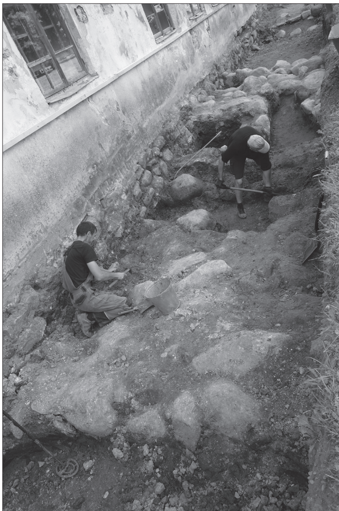
1. att. Arheoloģiskie pētījumi Nurmuižas pili (Talsu novads, Lauciene). Brūga attīrīšana pie pils rietumu korpusa. 2017. gada 26. jūlijs.