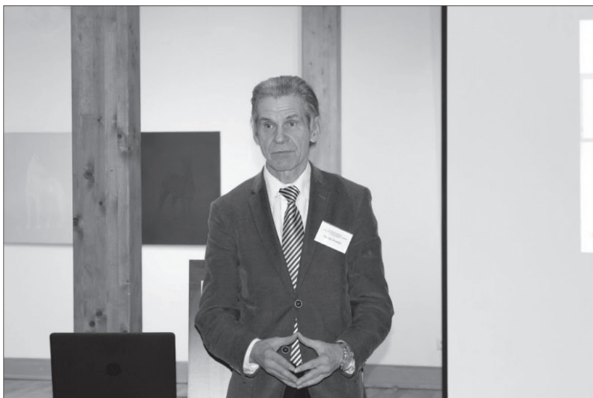
4. att. “Jauno vēsturnieku zinātniskie lasījumi” Valmieras muzejā. Konferenci atklāj LU LVI direktors Guntis Zemītis. 2017. gada 20. oktobris.

Pārskata periodā LU Akadēmiskās attīstības projektu rāmjos nozīmīgs darbs veikts institūta krātuvēs un Dendrohronoloģijas laboratorijā. Arheoloģisko materiālu krātuvē (AMK) tika veikta dažādos laikposmos (1945–2016) ienākušo fotonegatīvu ar kultūrvēsturisku nozīmi skenēšana, nozīmības izvērtējums un inventarizācija (200 filmas jeb 7200 kadri no 10 kolekcijām). Digitalizēti zīmētie lielformāta (A2, A1 un A0 izmērā) vienā eksemplārā esošie plāni uz lielformāta skenera (3000 vienības). 2017. gadā krātuvē uzsākta pārskatu krājuma digitalizācija (ieskenēti 102 pārskati), tika turpināta LVI arheologu veikto izrakumu zīmēto plānu saraksta veidošana pa kolekcijām Ms Access programmā (kopējais skaits 27 600 vienības).