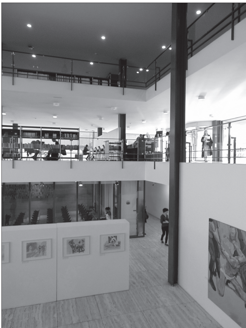
Lisabonas Universitātes bibliotēkas ēkas iekšskats. Attēlā redzama pagrabstāva līmenī esošā konferenču telpa, kurā notika referātu sesijas. Augšējos stāvos atrodas lasītavas.