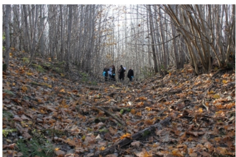
Tūrisma maršrutu prezentācija Alūksnē