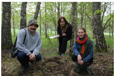
Foto: Antonija Vilcāne; Guntis Gerhards; Sarmīte Dundure, Vidzemes reģionālās nodaļas inspektore

Teksts: Antonija Vilcāne, projekta partnera un valsts koordinatore